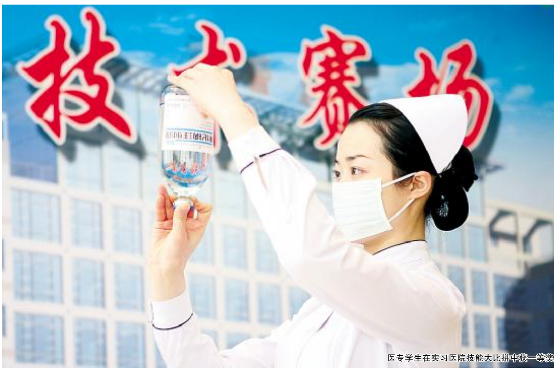
医专学生在实习医院技能大赛中荣获一等奖