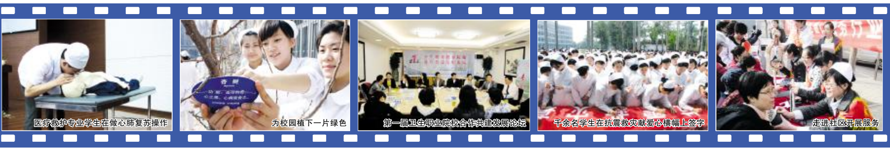
医疗教学专业学生在做心肺复苏操作