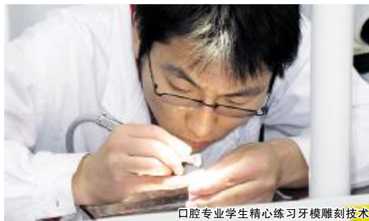
口腔专业学生精心练习牙模雕刻技术

依据行业对不同专业医学生职业道德的要求,将职业道德的培养内容融入各专业人才培养方案,体现专业特点。教师在传授专业知识的同时,注重教书育人,强化医学生的职业道德意识,提升医学生的职业素养。例如,护理专业实施的医学生职业道德培养,将“慎独”作为护理专业职业道德培养的重点内容。随着社会经济的快速发展,人口老龄化、子女少等问题日益突出,“无人陪伴病房”对护理人员的岗位能力和职业素养提出了更高的要求。所以,培养护理专业学生的“慎独”精神,不仅符合现代护理岗位职业素养的要求,同时更具有对未来护理岗位人才需求的前瞻性。